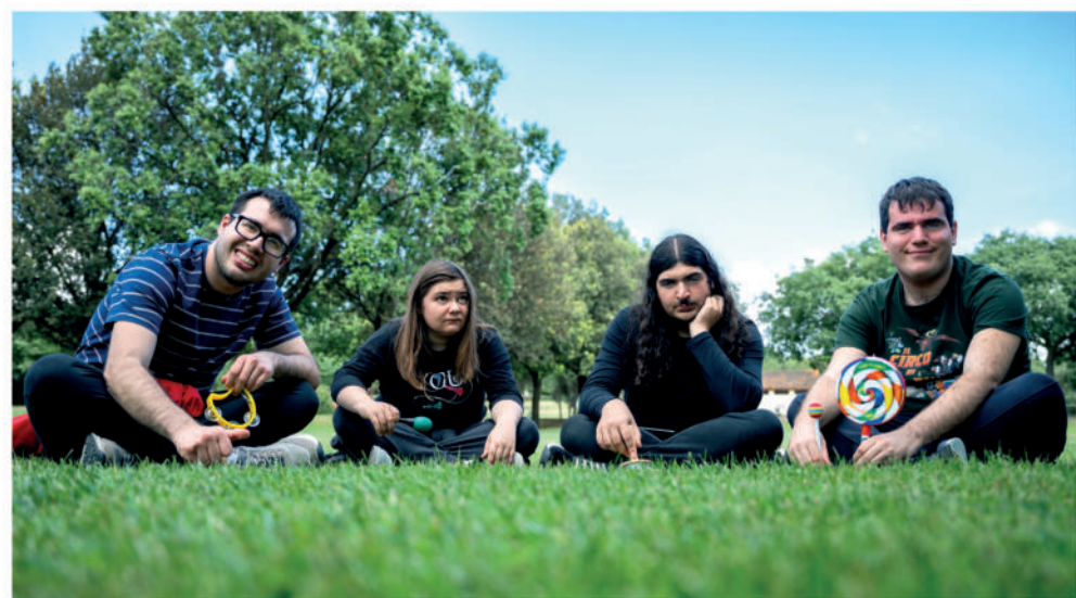
Lezioni di musica al parco