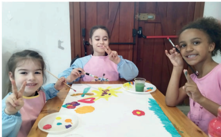
I sorrisi durante il laboratorio d'arte

Grazie al successo della campagna di adesione, che ha visto nuove imprese sposare con convinzione il progetto, ad oggi seguiamo un gruppo di bambini nell'età dell'infanzia e un gruppo di ragazzi appena maggiorenni per i quali sono proposte tante attività pensate per i loro diversificati bisogni faci-